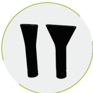
Bicos Chatos 35 e 60 mm