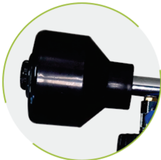
Sistema de Floculação Intensa