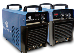
Inversores de Solda