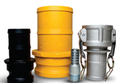
Conexões e Engates