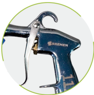
Corpo em Alumínio