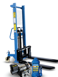
Movimentação e Outros